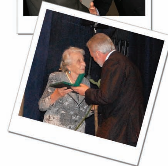
Министр здравоохранения Украины В.М. Князевич вручает награды лучшим из лучших