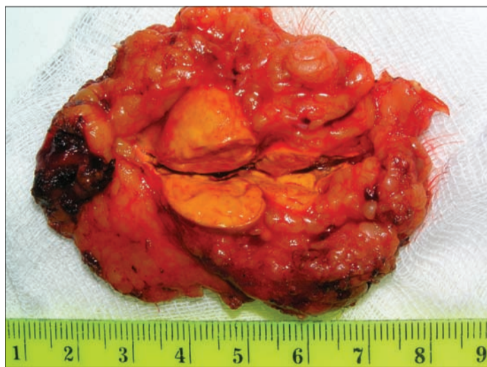
Макропрепарат видаленої лапароскопічно лівої НЗ з аденомою

виявили наявність двобічного пухлинного ураження НЗ: аденоматозне (за щільністю – 12 НУ) утворення правої залози розмірами 24 мм й аденоматозне утворення лівої НЗ менших розмірів – 12 мм (рис. 1). Враховуючи дані комп'ютерної томографії, потрібно було з'ясувати, чи є асиметрія в секретії